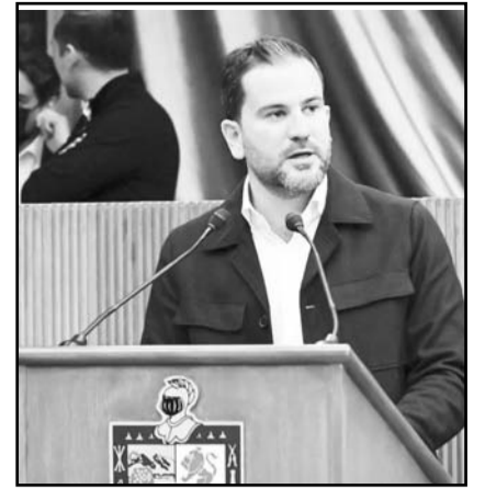
Diputado Raúl Lozano

trámite gubernamental. La propuesta contempla adicionar los artículos 104 bis a la Ley de Movilidad Sostenible y Accesibilidad. Señaló que "la prueba" del trámite o servicio, para la gratuidad de las dos horas, será el sello de la dependencia a la que se acudió. La propuesta fue presentada en la oficialía de partes del Legislativo, en espera que sea turnada a comisiones para su análisis y discusión.(JMD)