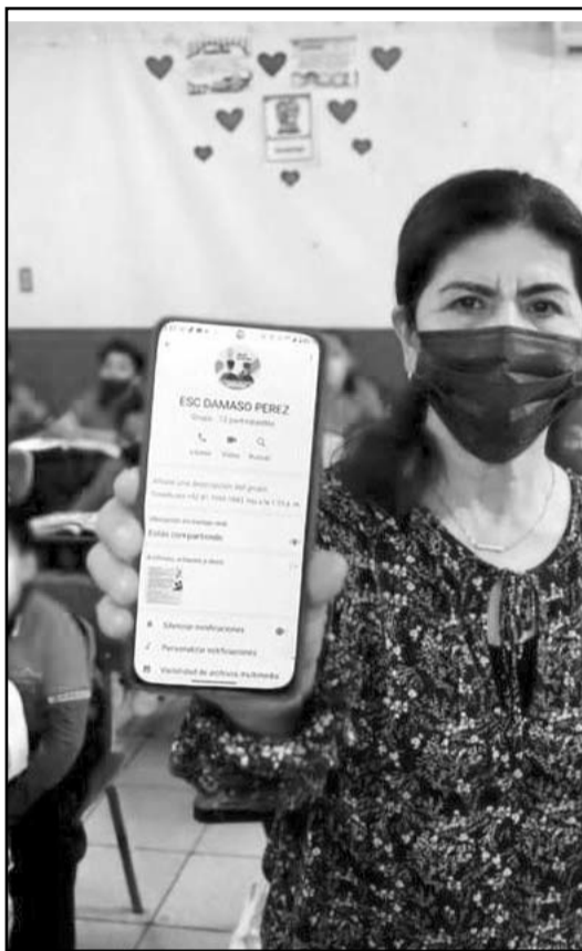
Conectan a los planteles educativos al C-4.

También habrá servicio de internet gratuito en el Polivalente de San Miguelito, en el Polivalente de Villas de San José, en el Monumento a Juárez, en el Polivalente de la Colonia Santa Mónica, en la Plaza Paseo Juárez y en la Tienda del Ahorro que está ubicada en contra esquina del Monumento a Juárez. (IGB)