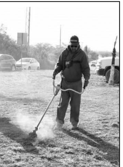
Se hacen trabajos en los cruceros.

y Carretera a San Roque. Con la ampliación de las dos avenidas en este punto, donde se construyó un carril adicional en cada uno de los cuatros sentidos de ambas vialidades, además de la semaforización, señalización y otras obras complementarias, se logró una mayor agilidad en el tráfico vehicular. "Con esta ampliación (de más carriles), la verdad que se está desfogando mucho el tráfico, vino a mejorar mucho este tipo de congestionamientos viales que se venían ocasionando anteriormente... Y ahorita la gente llega más a tiempo a su destino, ya no hay largas filas", dijo Paco Treviño. "Esta obra beneficia a muchas colonias de la zona sur principalmente, pero no solamente a los habitantes de Juárez, también en general a quienes atraviesan aquí el municipio, gente que viene de Cadereyta, gente de Guadalupe...", añadió. Además, anunció que pronto arrancarán las obras de ampliación de la Carretera a San Roque en un largo tramo más al sur. "Y desde luego que también para este año viene una ampliación más de aquí de la Carretera a San Roque, desde donde está el Deportivo San Benito hasta la Colonia Gardenias, se va a hacer una ampliación de un carril por sentido", dijo el Alcalde. (AME).