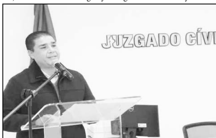
El alcalde de Juárez habló sobre lo que se ha hecho

ayuda social. "La Justicia Cívica es un nuevo modelo de justicia con el objetivo de restaurar el tejido social de nuestra comunidad... Y va enfocada en la prevención, trato digno y respeto a los Derechos Humanos, por lo que se han destinado recursos financieros, humanos y materiales para la implementación de este modelo", dijo el Alcalde. "Me enorgullece comentar que somos uno de los municipios de la zona metropolitana con mayor progreso en la implementación de la Justicia Cívica", añadió. También informó que pronto se presentará un proyecto para llevar la Justicia Cívica hasta las delegaciones de Seguridad Pública de este municipio, como lo son la de la Colonia Santa Mónica que ya está operando, y la de la Colonia Los Puertos que está próxima a inaugurarse.(AME)